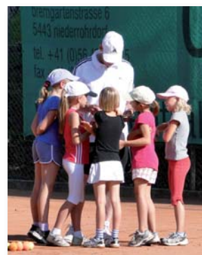
Interesse am Punktestand,