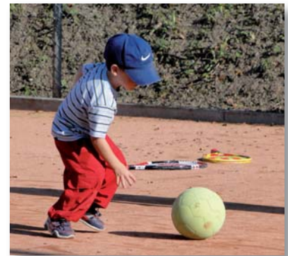
Mit etwas grösseren Bällen wurde ebenfalls gekämpft – in 4 Stärkegruppen und immer mit vollem Einsatz!