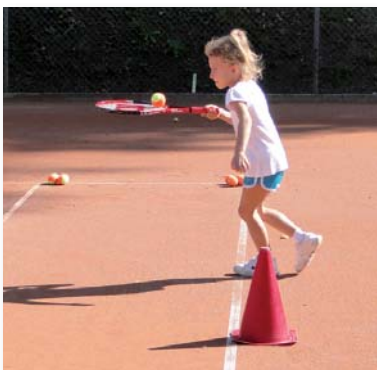
Geschicklichkeit mit Tennisball und Racket war gefragt,