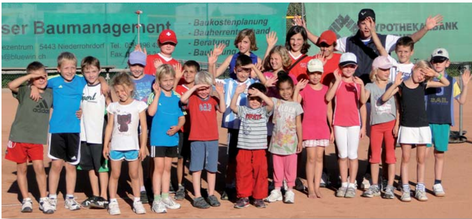
Eine grosse Teilnehmerschar