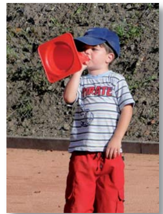
Auf los ging's los!